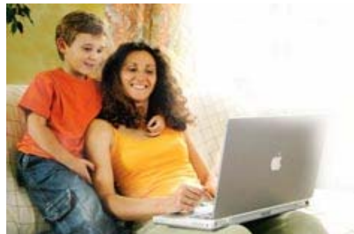
Deutsches-Shopverzeichnis.de – finden statt suchen

Das Elm@r-Projekt und die TRIOLOGIC GmbH haben eine enge Zusammenarbeit zur Weiterentwicklung der SHOPINFO.XML vereinbart. „Der Online-Versandhandel hat den Schritt in den europäischen Markt noch nicht wirklich vollzo-